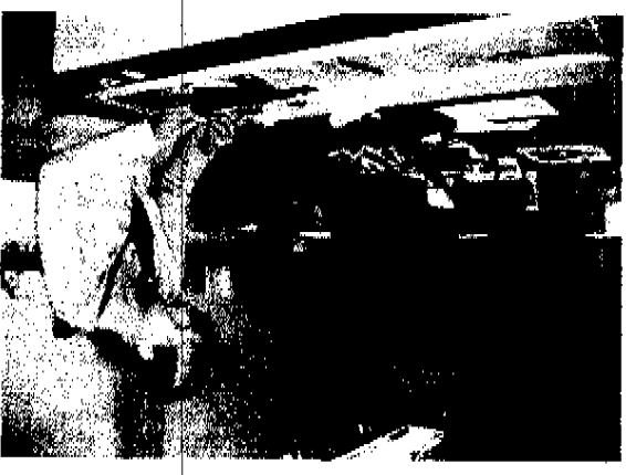
Arthur de Winkel in de Brugstraat in Breukelen heelt 'Lood om oud glas' een eigen atelier.

De consument Winkels lijken steeds meer op elkaar ROB MIDAVALINE